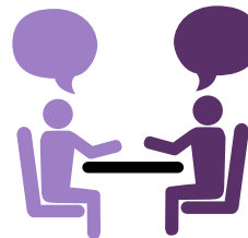
Échanges de personnel

... ainsi que d'autres formules de soutien novatrices.