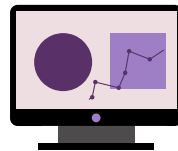
Lancement de la plate-forme de formations en ligne