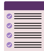
Bibliothèque de documents de référence