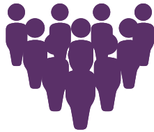
Cours et formation spécialisés