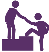
Mentorat et encadrement

ECOFEL entreprend des activités de renforcement des capacités visant les membres du Groupe Egmont ainsi que les candidats.