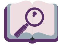
Produits d'analyse et de renseignement